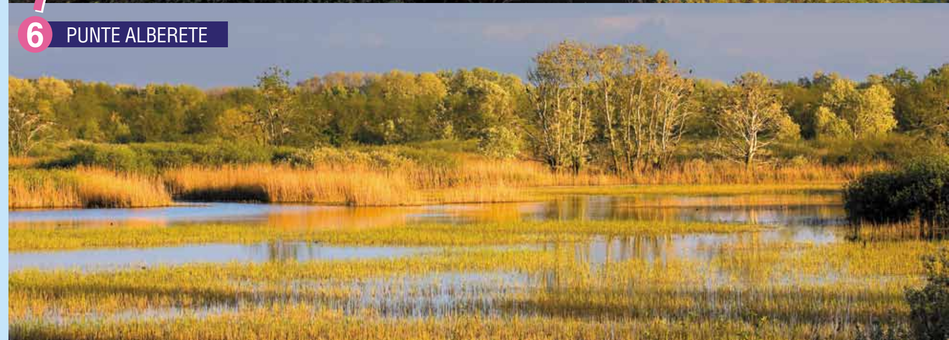
6 PUNTE ALBERETE

I Parco del Delta del Po, le Pro Loco di Casal Borsetti e di Marina Romea e l'Associazione di Volontariato L'Arca vi augurano un buon viaggio attraverso i mutevoli paesaggi naturali che testimoniano il passato di questo territorio e della sua evoluzione millenaria nel tempo, conservati dal tradizionale amore dei ravennati per la loro terra e dalla istituzione del Parco del Delta del Po.