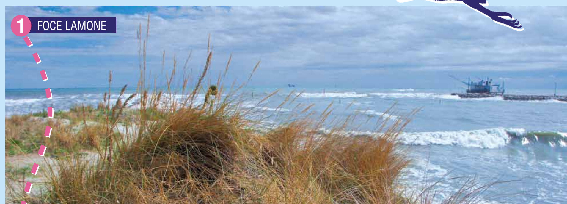
1 FOCE LAMONE

Qui infatti in un percorso di poco più di tre chilometri, facilmente percorribile a piedi o in bicicletta, si possono incontrare sei "stazioni" tipiche ognuna dell'evoluzione geomorfologica e paesaggistica della fascia costiera ravennate, illustrate sul posto da altrettanti pannelli illustrativi contenenti informazioni storiche e naturalistiche.