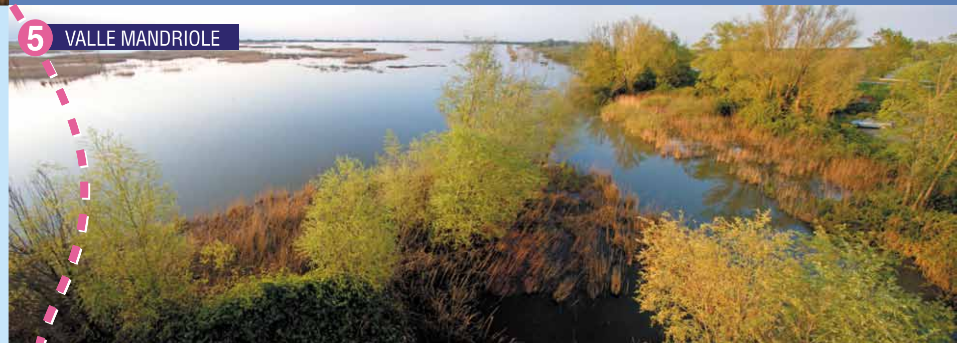
5 VALLE MANDRIOLE