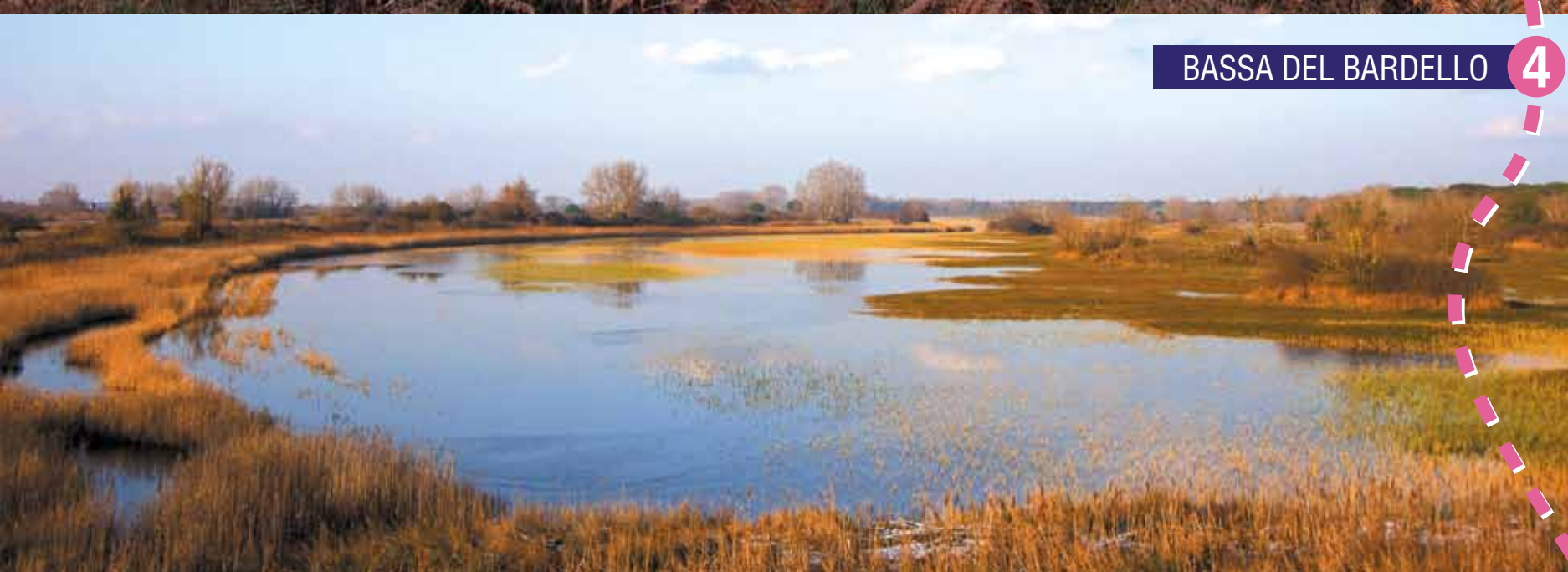
4 BASSA DEL BARDELLO