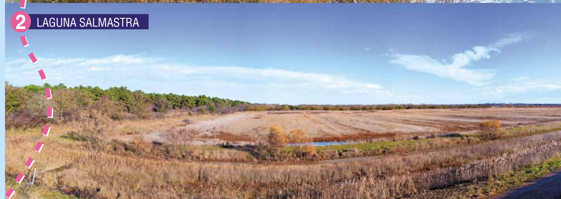
2 LAGUNA SALMASTRA