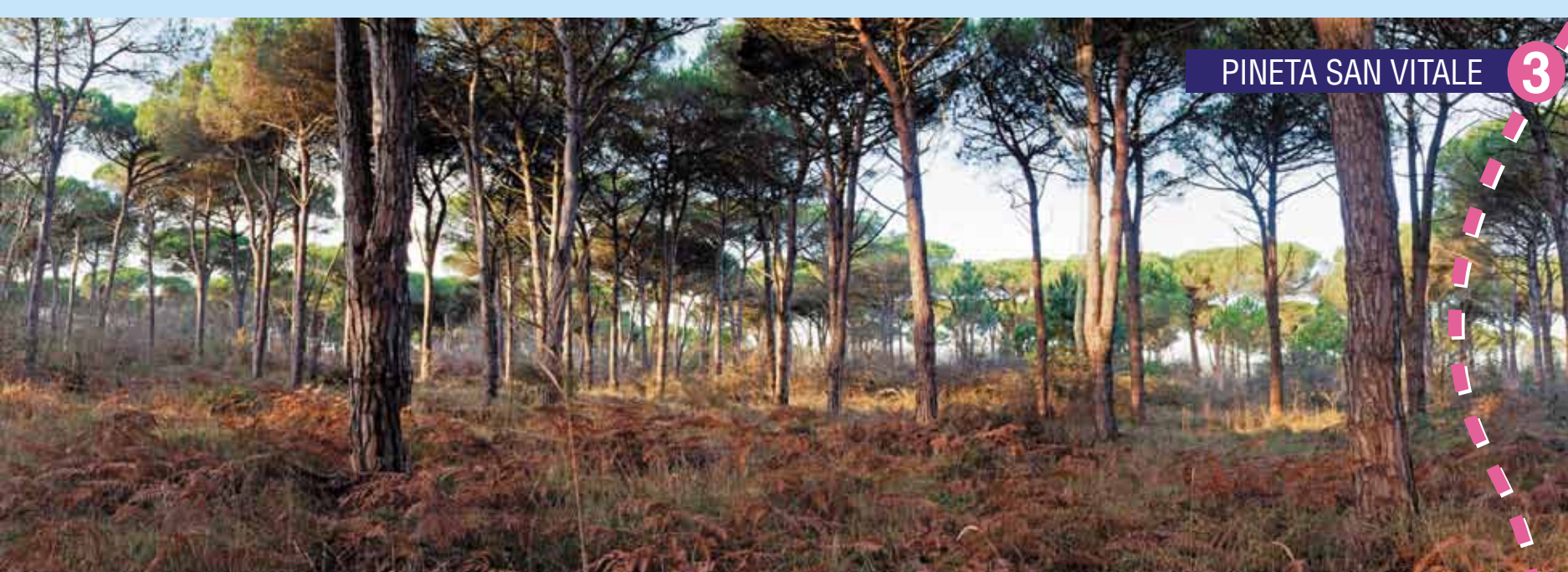
3 PINETA SAN VITALE